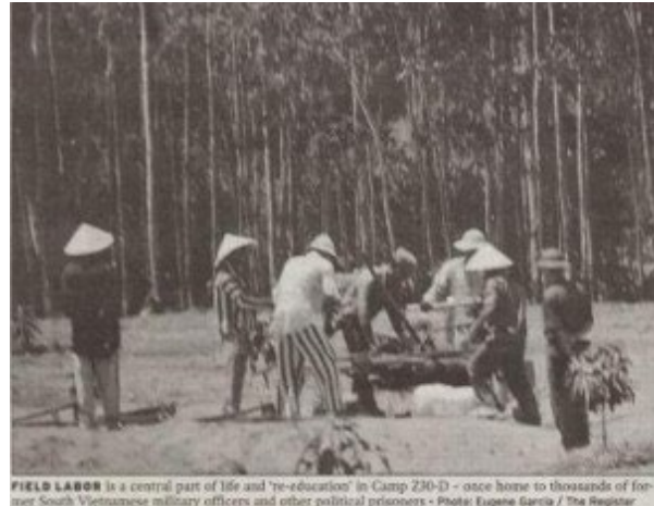
FIELD LABOR is a central part of life and 're-education' in Camp 230-D - once home to thousands of former South Vietnamese military officers and other political prisoners

Trại Lý Bá Sơ, Bắc Việt Nam { https://hungviet.org/a25631/viet-ve-cuu-tu-truong-ly-ba-so-trinh-van-thich }