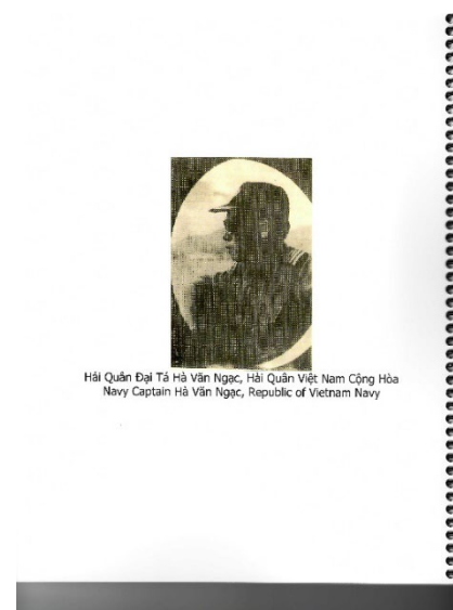
Hình bìa sau của cuốn tài liệu