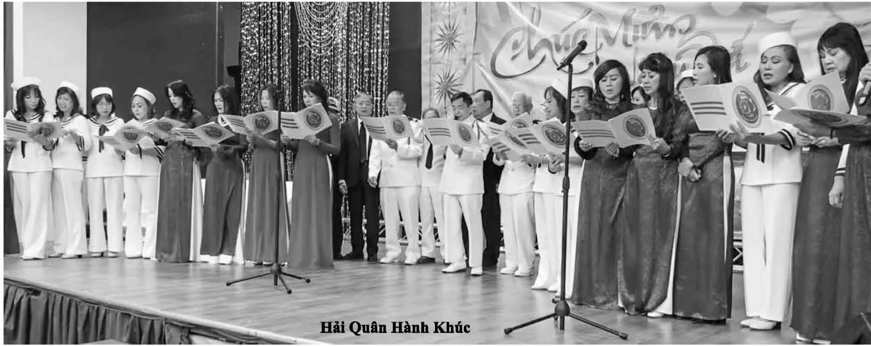
Hải Quân Hành Khúc