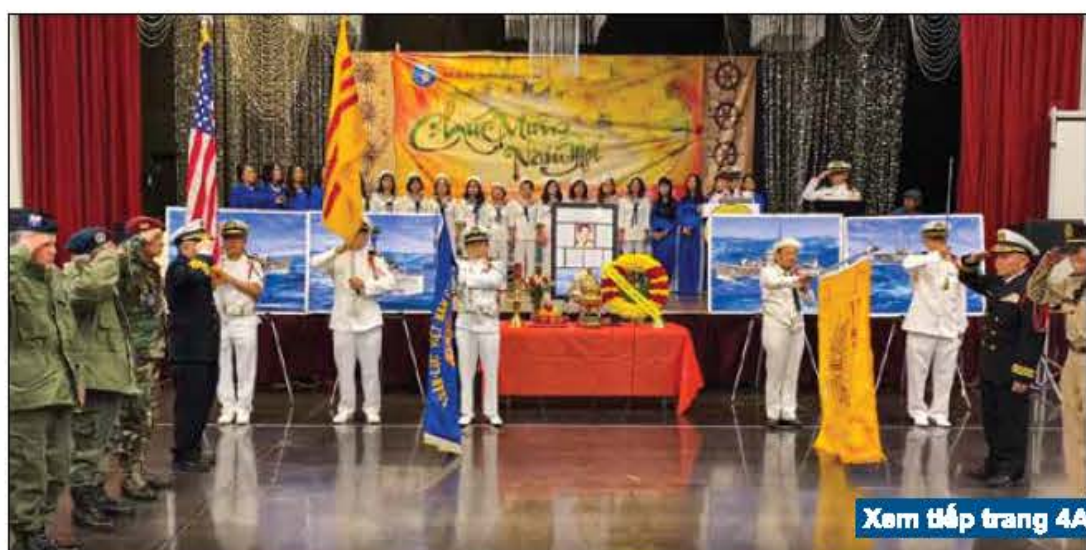
Xem tiếp trang 4A