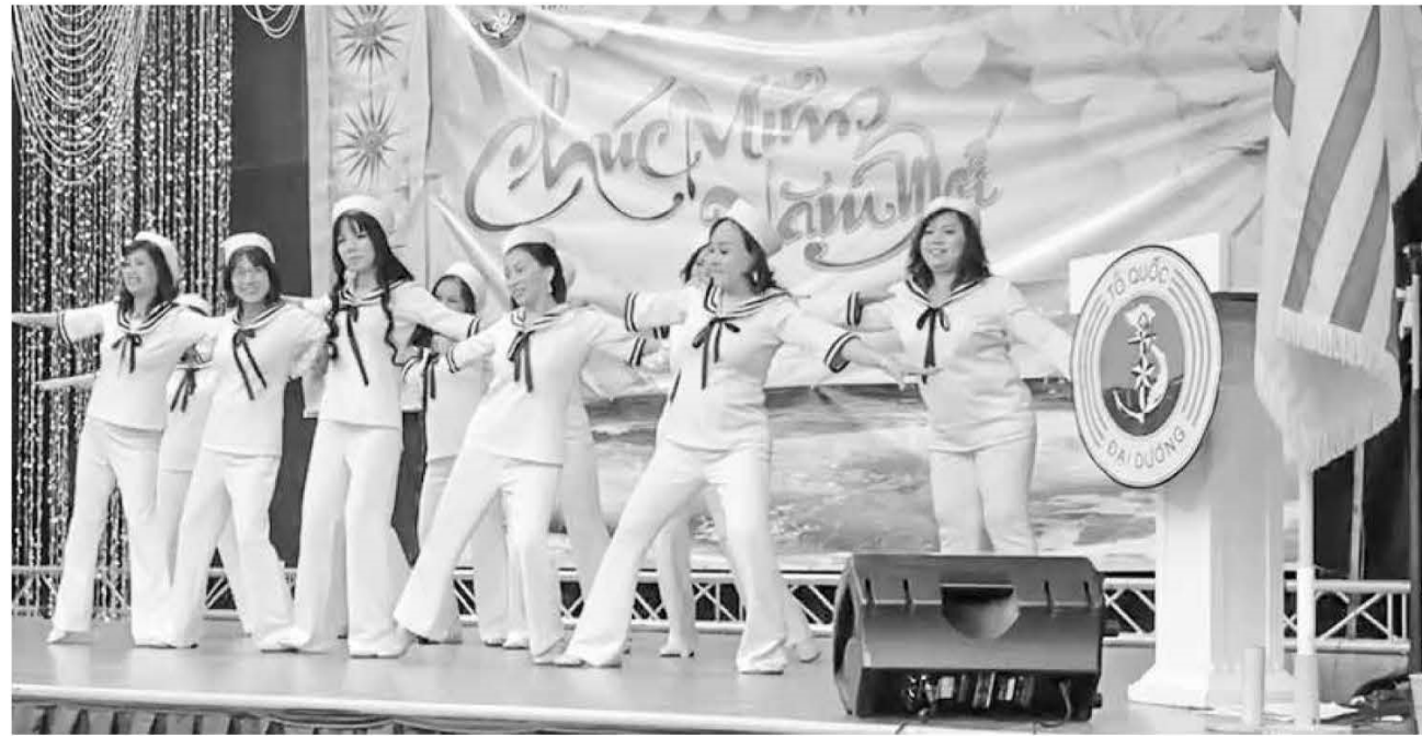
Sân Khấu Nhỏ trình diễn

Grand Prairie, TX.- Chủ Nhật ngày 14 tháng 01 năm 2024, Hội Hải Quân Trùng Dương Dallas-Fort Worth đã tổ chức Tưởng Niệm 50 năm Trận Chiến Hoàng Sa và tổ chức Dạ tiệc Xuân Chiến Sĩ năm 2024.