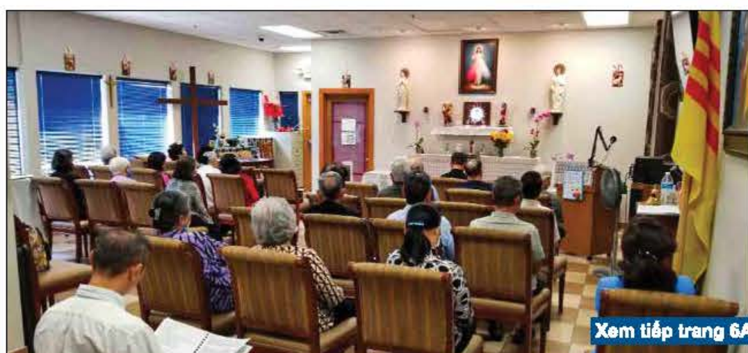
Xem tiếp trang 6A

Trung tâm Tuổi Vàng thành phố Arlington đã là một trung tâm sinh hoạt dành riêng cho những người cao niên dưới sự quản trị và điều hành của ông bà Bác sĩ Nguyễn Ý Đức từ lâu được nhiều người biết đến.