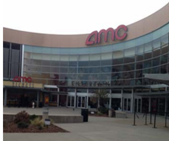
Rạp AMC tại khu Firewheel Mall